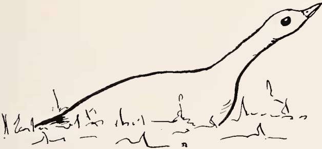
Abb. 10: Begattungs-aufforderung der Henne.

1974 hatte ich zur Brutzeit nur noch eine Henne. Ich hielt sie mit einem Hahn zusammen in einer Voliere, bis sie Ende Mai wieder die typische Abwehr gegen ihn zeigte. Als ich das erste Ei im Legedarm fühlte, brachte ich diesen Hahn und alle weiteren in der Nähe untergebrachten Hähne für die Henne außer Sichtweite. Darauf machte die Henne ein Nest, beruhigte sich sofort und legte am 12. 6. ihr erstes Ei, am 14. 6. das zweite und am 16. 6. das dritte. Morgens bei der Fütterung lief die Henne unruhig am Volierengitter auf und ab und maunzte leise. Hinter dem Haus balzten zwei Hähne. Dieses Maunzen war neu, und ich hatte sofort den Eindruck, daß die Henne zum Hahn wollte. Sie war gestutzt, ich öffnete die Volierentüre und die Henne lief gleich in Richtung der balzenden Hähne. Ich fing einen der Hähne, brachte ihn zur Henne und ließ ihn etwa 20 m von ihr entfernt